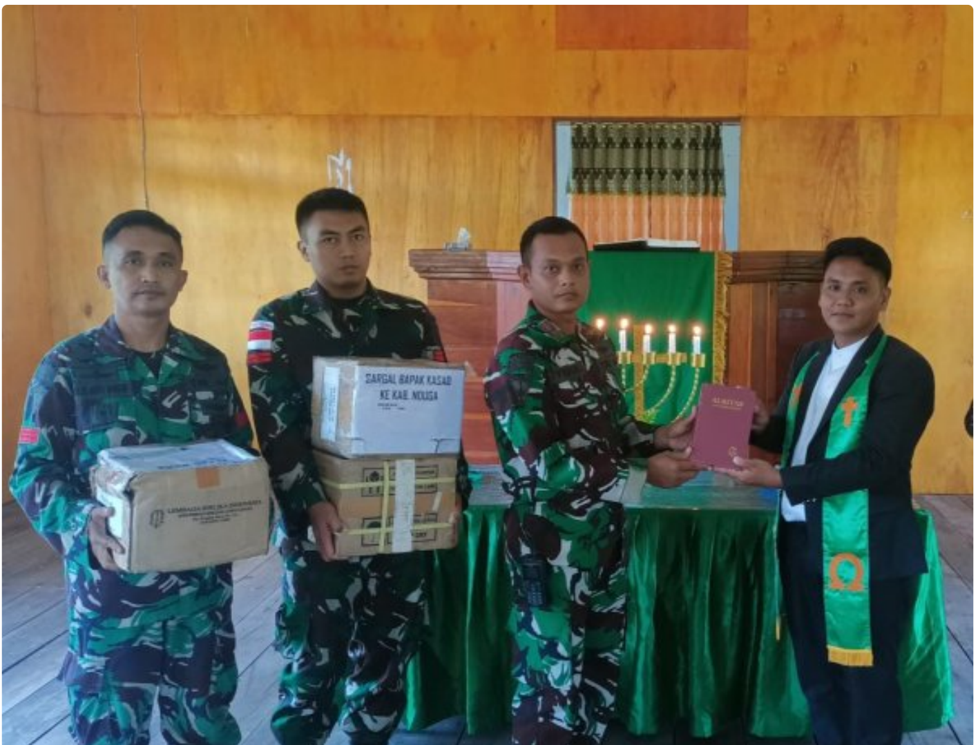
Foto: Satgas Yonif 503/Mayangkara kembali menunjukkan dedikasinya kepada masyarakat di Papua dengan memberikan dukungan alat musik untuk kegiatan ibadah di Gereja GKI Bethesda Batas Batu, Distrik Krepkuri, Kabupaten Nduga. Pada Minggu, 12 Januari 2025.

NDUGA- Satgas Yonif 503/Mayangkara kembali menunjukkan dedikasinya